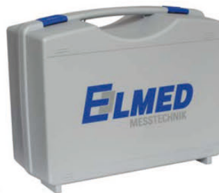
Transportbox im Lieferumfang enthalten

Das batteriebetriebene Gerät verfügt über eine PTB-rückführbare Kalibrierung, welche von allen Zertifizierungsstellen anerkannt wird.